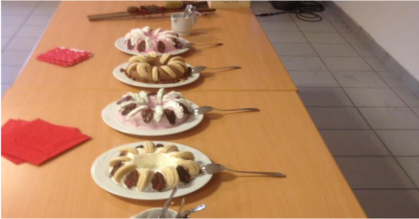
Kerstlunch 10 december 2017