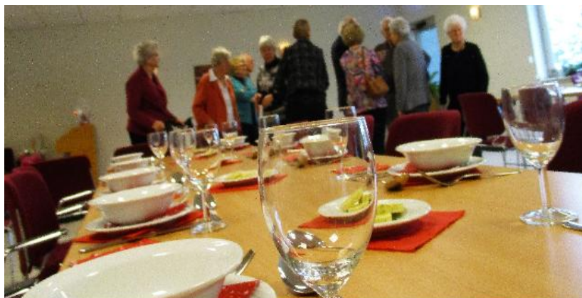
Kerstlunch in de Kogge, 10 december 2017