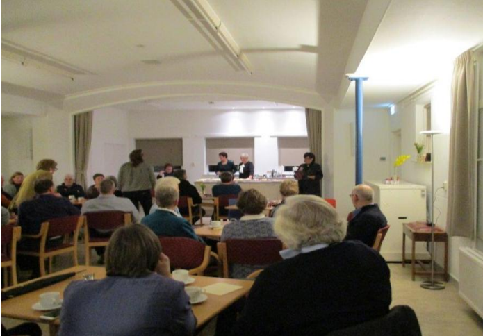
Feestelijke heropening Zwingebouw 17 februari 2017